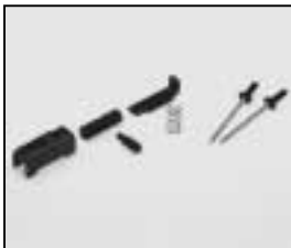
L4.79239.E Door catch Deckelverriegelung