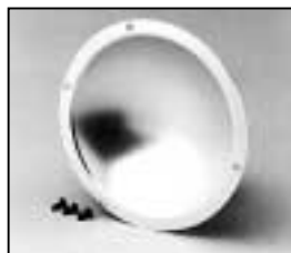
L4.79237.E Reflector Reflektor