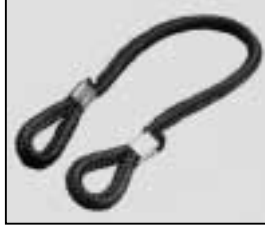
L4.79855.E Cable tie Halteleine