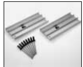
L4.79233.E Side extrusions Tragleisten