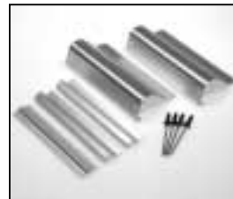
L4.79232.E Set of bottom plates Set Bodenbleche