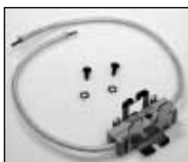
L4.79229.E Lamp holder Lampenfassung