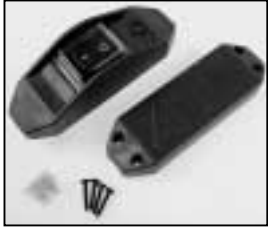
L4.77157.E Inline switch complete 110 – 240 V Schnurschalter komplett