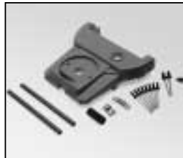
L4.79226.E Rear casting Rückteil