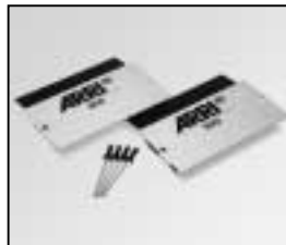
L4.79230.E Set of side panels Set Seitenbleche