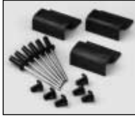
L4.79240.E Set of accessory brackets Set Torhalter