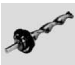
L4.79234.E Focus spindle Fokusspindel