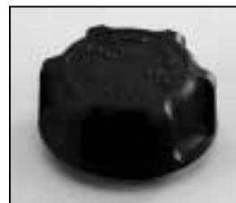
L4.79036.E Focus knob Fokusknopf