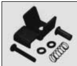
L4.79244.E Top latch, new version Verschlussklaue, neue Ausf.