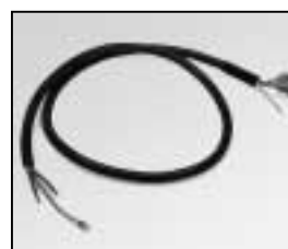
L4.79132.E Head to switch cable Kabel (Silicon)