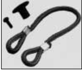
L4.79242.E Cable tie set Halteleine Set