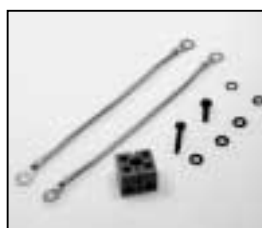
L4.79238.E Terminal block Kabelklemme