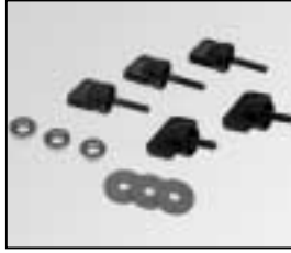
L4.79243.E Set of locking knobs Satz Arretierschrauben