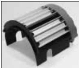
L4.79070.E Top cover Deckel mont.

NOTE: WHEN ORDERING QUOTE PART NUMBER BEMERKUNG: BEI BESTELLUNG IDENT.-NR. ANGEBEN