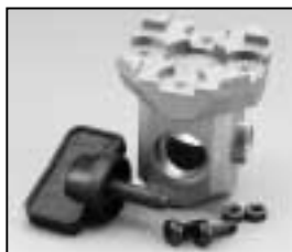
L4.77145.E 16 mm stirrup socket Hülse für Bügel