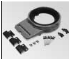
L4.79225.E Front casting Frontteil