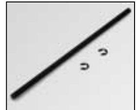
L4.79231.E Top cover hinge spindle Deckelachse