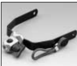
L4.79227.E Stirrup complete Haltebügel komplett