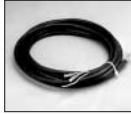
L4.79228.E L4.79732UE (USA) Mains cable Netzkabel