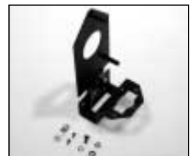
L4.79235.E Lamp carriage Fokusschlitten