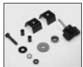
L4.79241.E Mounting set for stirrup Bügelbefestigungssatz